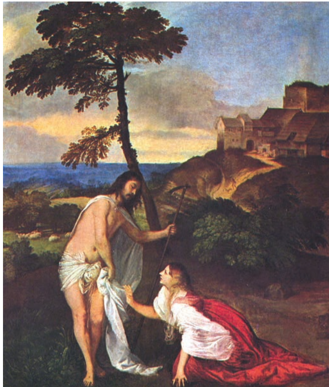
Noli Me Tangere. Titiaan, 1514

Het verschijningsverhaal dat de evangelist Johannes vertelt en dat door Titiaan werd verbeeld, heeft de waarschuwing van die ontwijkende Jezus voor altijd in ons bewustzijn gegrift: Noli me tangere , 'Houd mij niet vast'.