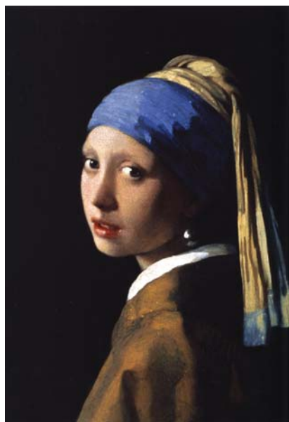
Girl with the pearl earring Johannes Vermeer