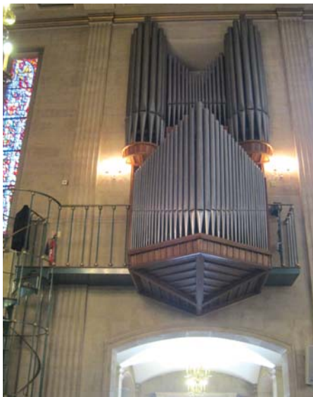
Orgel Nederlandse Kerk, gebouwd 1954

Ten eerste is er het prachtige orgel, gebouwd in 1954 door Willem van Leeuwen en gerestaureerd en gereviseerd in 1995. Dit orgel is met haar heldere geluid karakteristiek voor deze periode van orgelbouw en is het enige Van Leeuwen-orgel in Groot-Brittannië. Na de restauratie in 1995 is het nu weer tijd voor een grondige revisie- en onderhoudsbeurt, met name van de mechanische delen waar noodreparaties onvoldoende soelaas bieden. Voor deze grote uitgave dient ongeveer £25.000 beschikbaar gesteld te worden. Natuurlijk worden