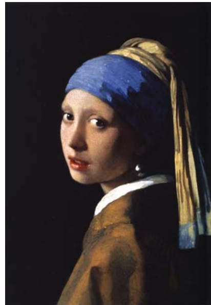
Girl with the pearl earring Johannes Vermeer