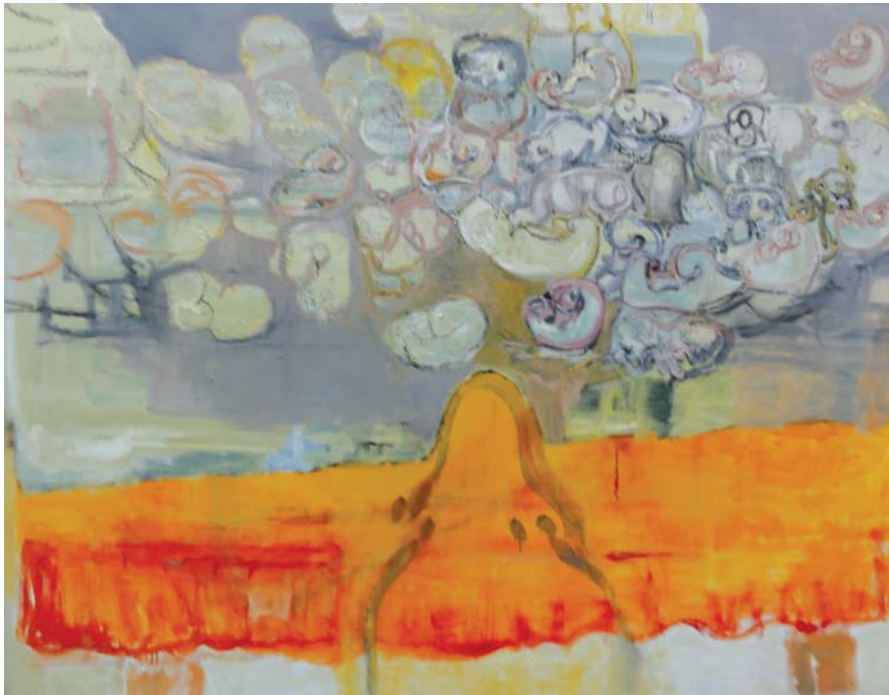
Het Laatste Avondmaal: Marlene Dumas

De kerk heeft in deze redenering immers haar oorsprong in de Eeuwige, en in zijn belofte, dat Hij voor ons gekozen heeft, en die keuze niet ongedaan zal maken. Alle duisternis, alle onzichtbaarheid en alle kerkverlating van de hele wereld is niet in staat om die belofte te niet te doen. Die belofte is natuurlijk ook geen eenvoudige aanname. Want er blijft te allen tijde een spanning tussen de onzichtbare waarheid van liefde en groei, en de zichtbare werkelijkheid waar verdriet en pijn deel van uitmaken.