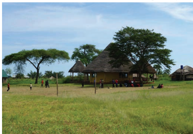
Hope North Arts Centre

HOPE NORTH is een kleinschalig project in Uganda, in 2000 opgezet door Sam Okello. In Noord-Uganda heeft lange tijd een gruwelijke oorlog gewoed, waarbij vooral jonge kinderen als soldaten werden geronseld. Nadat ook zijn broer in deze oorlog omgekomen was, heeft Sam Okello besloten in het veilige gebied ten zuiden van de Nijl een opvangcentrum te creëren. Waar aan jonge mensen uit Noord-Uganda die op enige manier slachtoffer zijn geworden van deze oorlog, een thuis en een opleiding