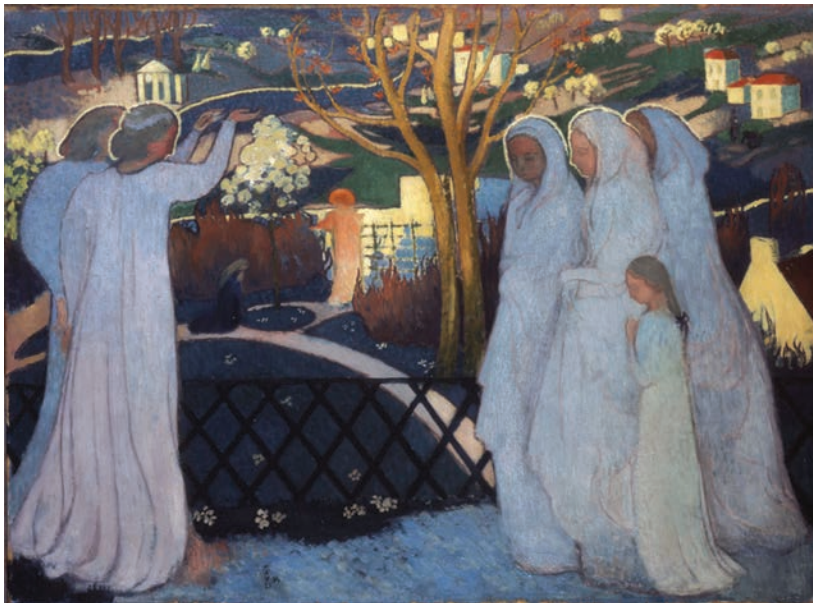
Matinée de Paques: Maurice Denis

Als dat al waar is voor 'gewone' mensen, hoeveel te meer dan niet voor de mens, Jezus, die iemand eens heeft omschreven als 'de hese stem die de wereld veranderde'.