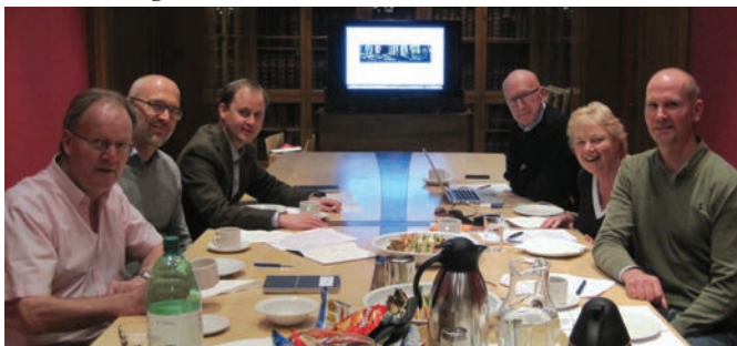
Het website team