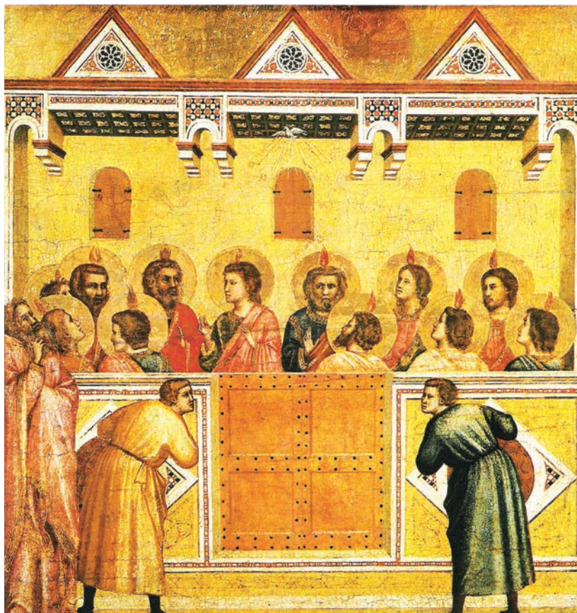
'Pinksteren' Giotto 1310

Kijk maar naar de politiek en de huidige campagnes in het Verenigd Koninkrijk. Iedereen lijkt zich terug te trekken op zijn eigen eiland. Weg uit Europa, weg uit het Verenigd Koninkrijk, er gaat niks boven Londen. Wij schrijven gemeenschappen af en maken op basis van die negatieve gevoelens een nieuwe gemeenschap. Dat lijkt mij gevaarlijk, om mensen te verenigen op basis van wat ze aan onvrede en angst ervaren. Want achter die angst en onvrede gaan gewone vragen en verlangens schuil: waar kom ik vandaan? Waar ga ik naar toe, en hoe zal de toekomst voor de volgende generatie zijn?