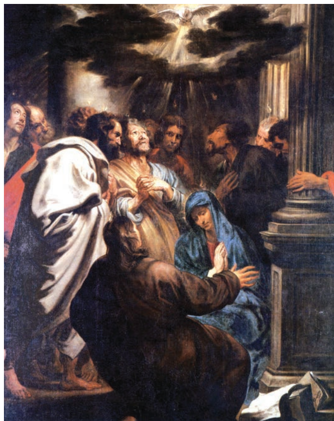
De komst van de Heilige Geest, Antonie van Dijck (1618 - 1620)