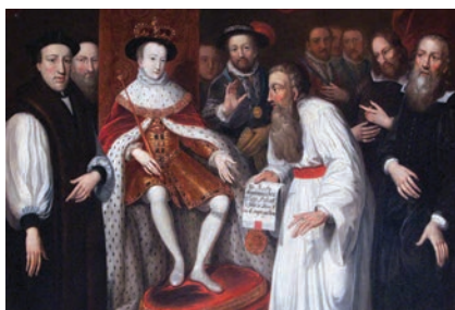
Edward VI and Johannes a Lasco

1552 and Archbishop Thomas Cranmer was seething with rage. The printing of the second edition of his Book of Common Prayer had been summarily halted. Sensing remnants of popery, Johannes a Lasco (1499-1560), a Polish reformer who was one of the leading figures of the European Reformation, was particularly opposed to the Anglican practice of kneeling at the Eucharist. He had teamed up with John Knox, the firebrand Scottish reformer, to oppose Cranmer and the Church of England. Having arrived in London as an exile two years earlier, A Lasco was appointed by Edward VI as the first Superintendent of the Strangers' (now the Dutch) Church in 1550. Three years later, he and his congregation of some three thousand refugees from the Low Countries were forced back into exile once again during the reign of Catholic Mary Tudor, a turbulent period which saw Cranmer burnt at the stake.