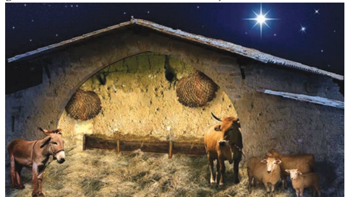
Een koud, donker schuurtje

Zondag 20 december spelen de kinderen van de Nederlandse Kerk een levendig kerstspel tijdens de dienst. Iedereen, van jong tot oud, is van harte welkom! Engel Gabriel heeft een belangrijke opdracht gekregen van God. Hij is vanuit de hemel naar de aarde gevlogen om het Grote Plan Gods aan te kondigen. Er zal een bijzonder kind geboren worden, dat vrede op aarde brengt. Maar het plan lijkt helemaal mis te gaan! Jozef en Maria, de ouders van de baby, moeten plotseling op reis. Er is geen plek in de herberg, en de baby wordt geboren in een koud, donker schuurtje.