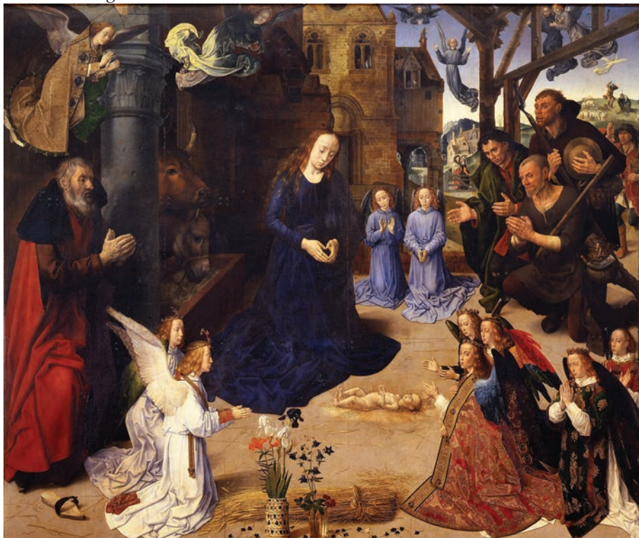
'Portinari altarpiece' Hugo van der Goes 1478