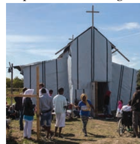
'Jungle Church' Calais

De diaconie wil graag een actieve bijdrage leveren aan de vraagstukken rondom het actuele Europese vluchtelingen probleem. We zijn nog zoekende hoe we dat het beste invulling kunnen geven. Onze predikant, ds. Joost Röselaers, kreeg een praktisch verzoek om te kijken of wij konden helpen om de kerk, gemaakt van houten latten en plastic, in de Jungle van Calais meer winter-proof