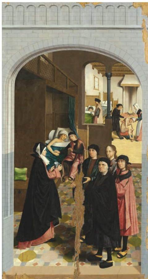
Meester van Alkmaar (anno 1504)