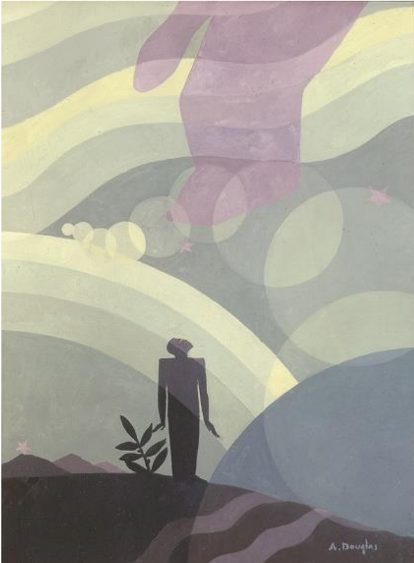
Aaron Douglas, the Creation