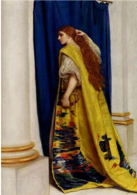
Ester door Sir John Everett Millais