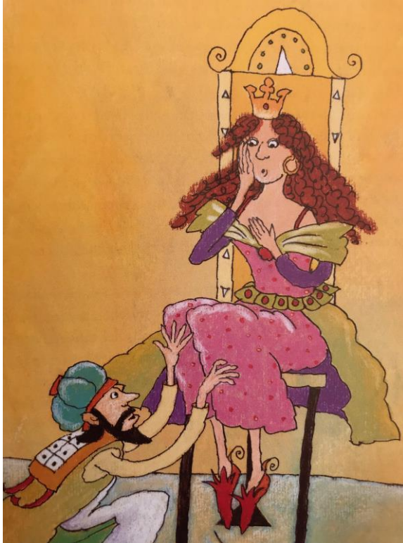
Haman smeekt bij Koningin Ester. afbeelding Guida Joseph