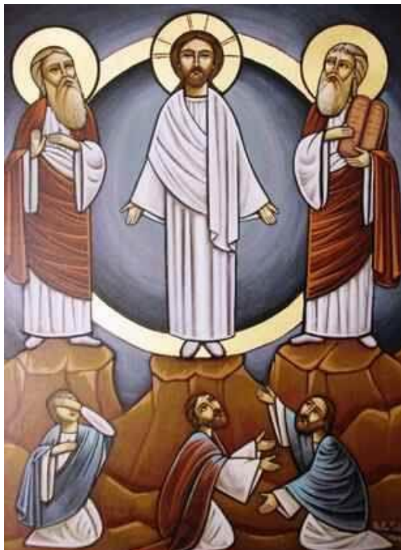
Transfiguratie Icoon uit Armenië.