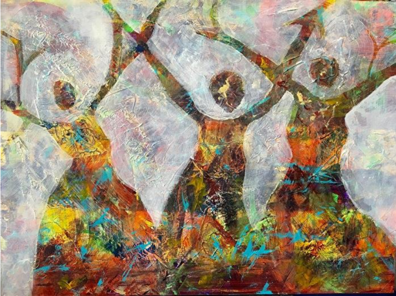
Jubilate by Victoria Castle