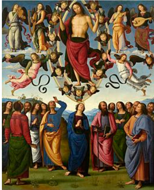
The Ascension of Christ – Pérugin, Musée de Beaux Arts de Lyon