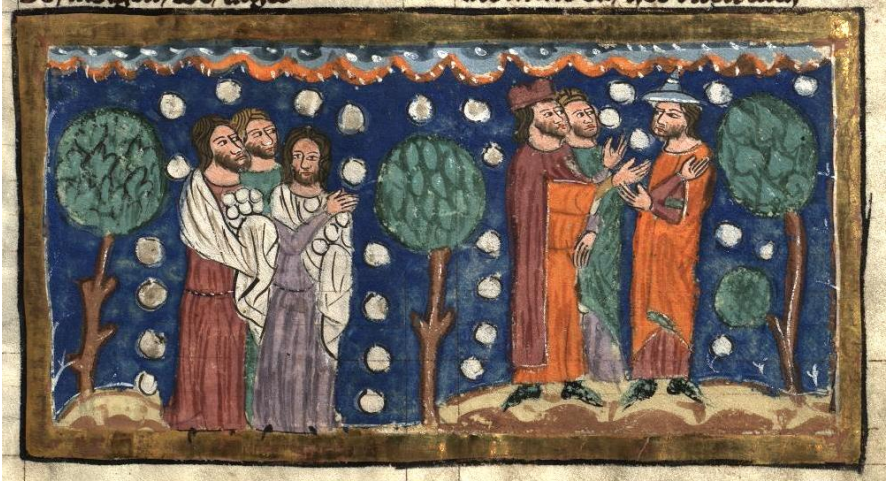
Psalm 78 vers 23-29 Manna uit de hemel