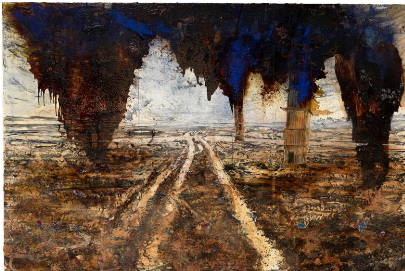
Rorate Coeli, by Anselm Kiefer