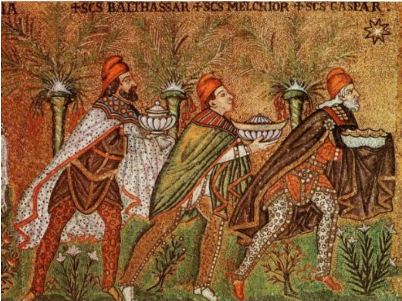
Mozaïek 6 e eeuw, St Apollinare Nuovo te Ravenna, Italië.