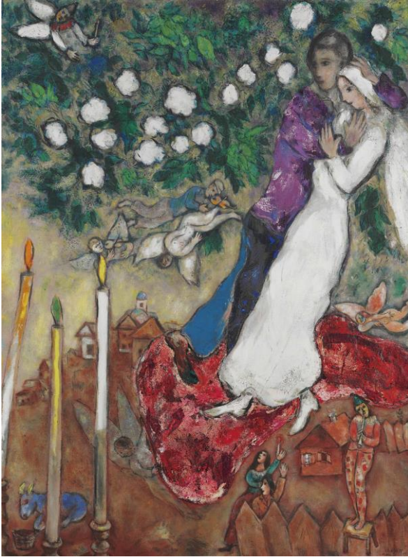
Marc Chagall, de bruiloft