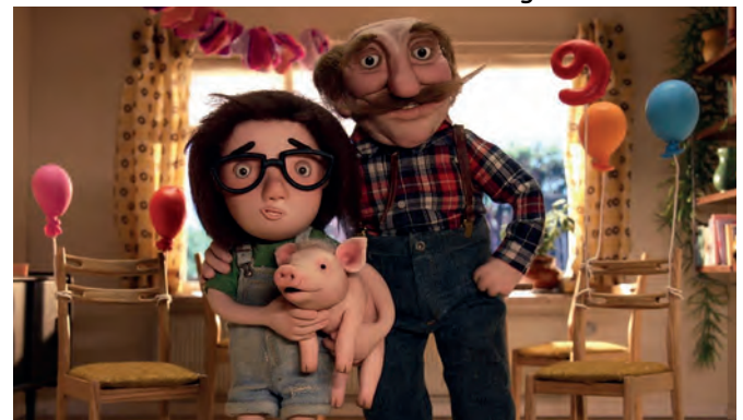
Familiefilm Knor op 8 januari in Austin Friars

Op zondag 8 januari komen we alweer bij elkaar. Hopelijk is iedereen dan net weer terug van een welverdiende kerstvakantie. Op deze zondag horen we in de kerk het verhaal van Driekoningen.