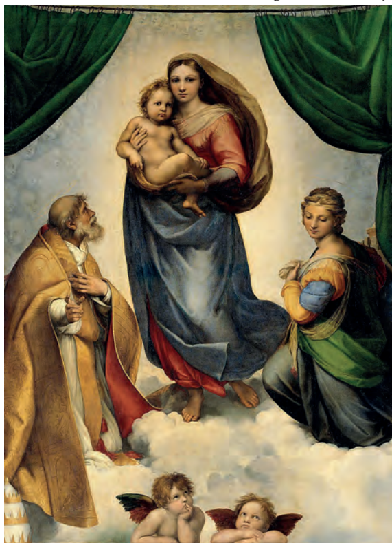
'Madonna di San Sisto' Raphael (1514)

we in de Nederlandse Kerk juist inzoomen op die vijf vrouwen die genoemd worden in dat verhaal over de herkomst en worteling van Jezus. Vijf vrouwen die cruciaal zijn geweest in dat verhaal van de komst van de Messias. Zonder hen had God het niet gered, zou je kunnen zeggen. En aan alle vijf kleeft een fascinerend verhaal. Tamar, Rachab, Ruth, Bathseba, en Maria.