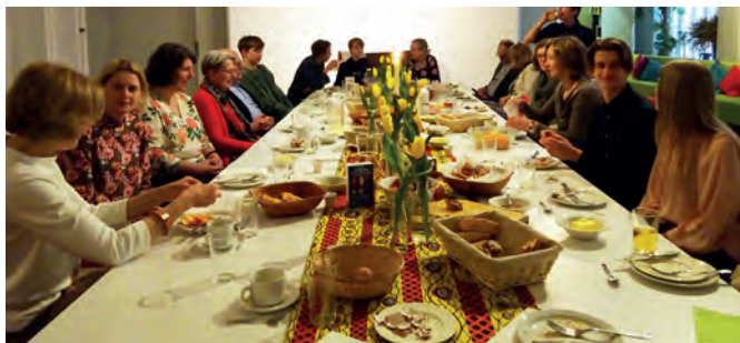
Paasontbijt op 9 april

Met Goede Vrijdag en Paasmorgen hebben we weer een bijzondere kleine paascyclus. Op Goede Vrijdag 7 april hebben we om 11.00 uur een viering waarbij we eerst het laatste avondmaal vieren zittend rond de tafel. Daarna verplaatst de dienst zich naar het schip van de kerk en horen we het lijdensverhaal uit het evangelie van Johannes afgewisseld met passiemuziek door het vocaal ensemble o.l.v. Greg Hallam.