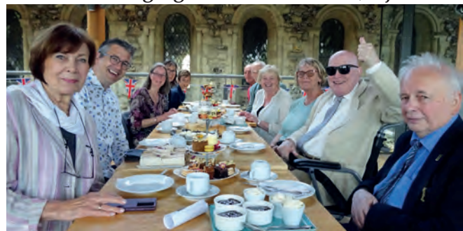
Afternoon Tea in Norwich

Onze jaarlijkse Nederlandse viering in Norwich, vindt dit jaar plaats op zondag 4 juni, zondag Trinitatis. De dienst, in één van de zijkapellen van de kathedraal begint om 13.30 en om 14.30 uur komen we samen in de Refectory van de kathedraal voor een gezellige Afternoon Tea. Meer informatie, email: info@dutchchurch.org.uk